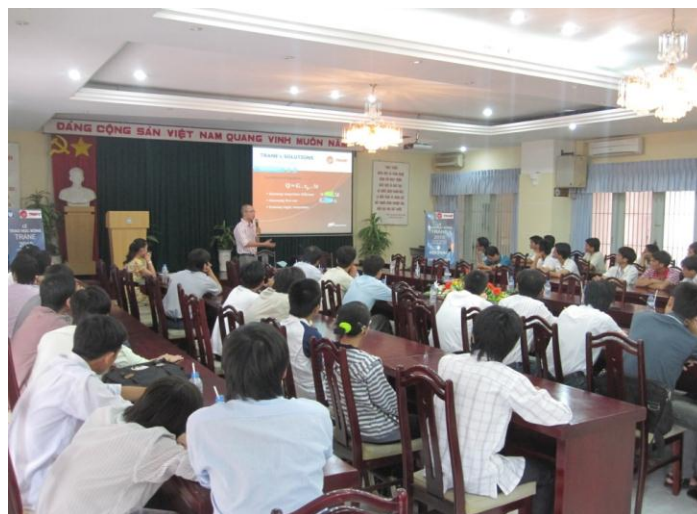
Hình 3: Phần hội thảo các giải pháp thiết kế xanh của Hệ thống ĐHKK