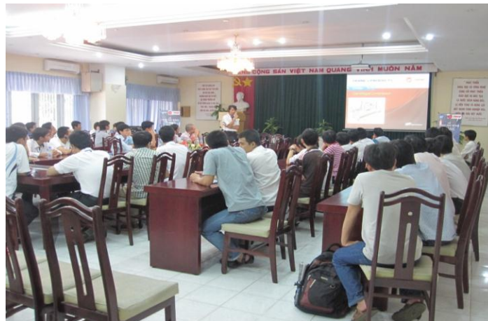
Hình 2: Toàn cảnh buổi lễ trao học bổng