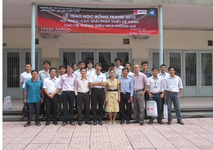
Hình 5: Thầy cô và đại diện công ty Trane chụp hình lưu niệm với SV khóa 06