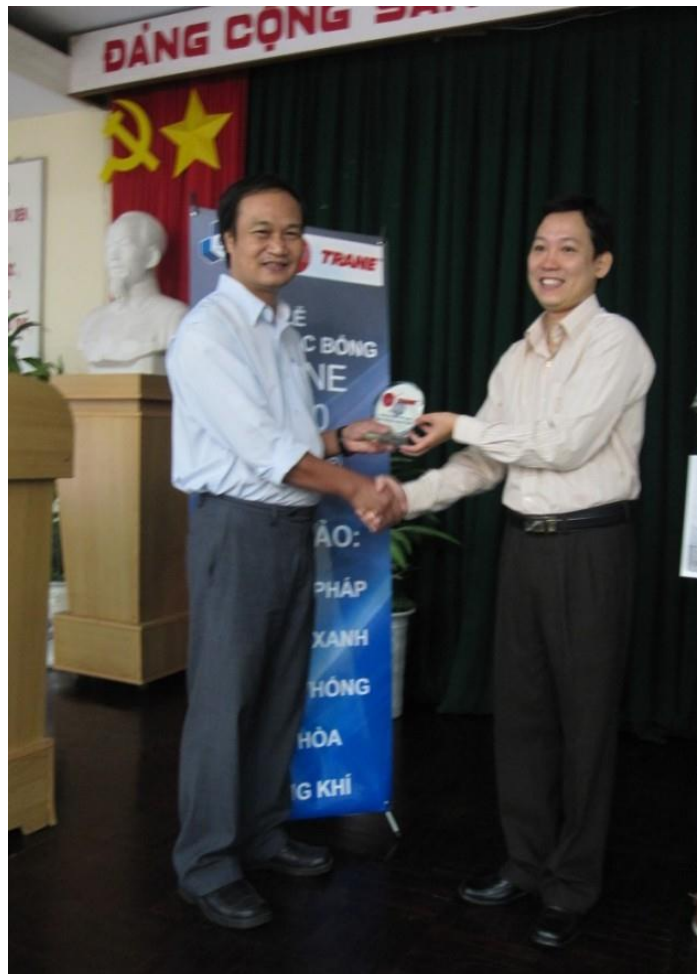
Hình 4: Đại diện công ty Trane trao kỷ niệm chương cho Bộ môn Nhiệt Lạnh